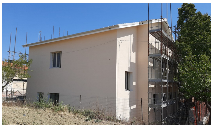
RECUPERO DELLA VECCHIA SCUOLA A PILI