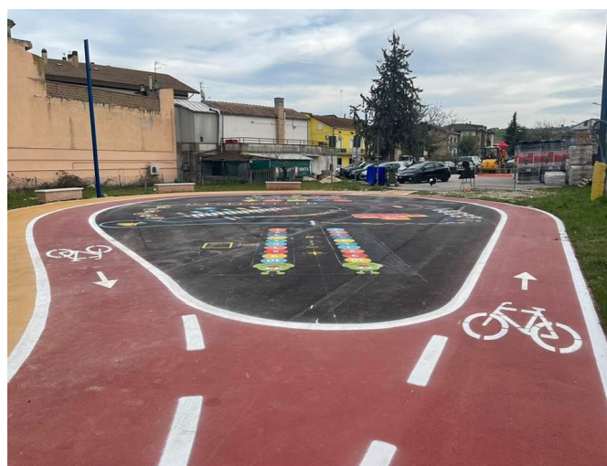
PISTA CICLABILE E PARCO GIOCHI A SAN LUCA