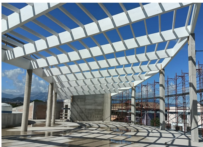
POLO DELL'INFANZIA PIAZZANO