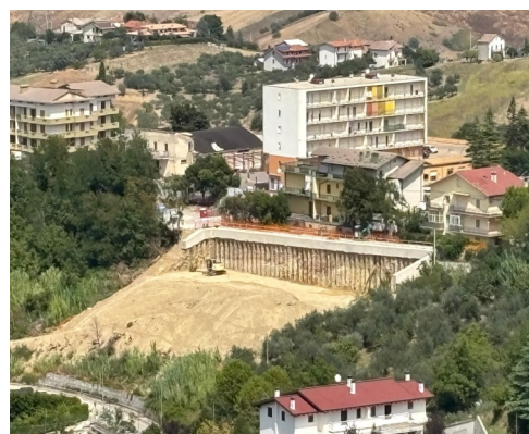
CANTIERE NUOVA CASERMA DEI CARABINIERI