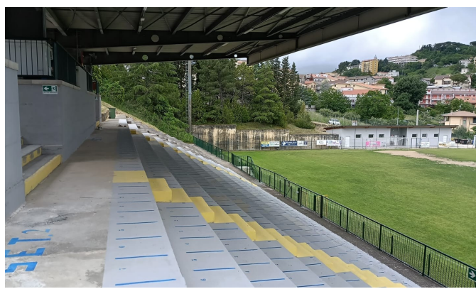
NUOVI SPOGLIATOI E MESSA A NORMA STADIO FONTECICERO